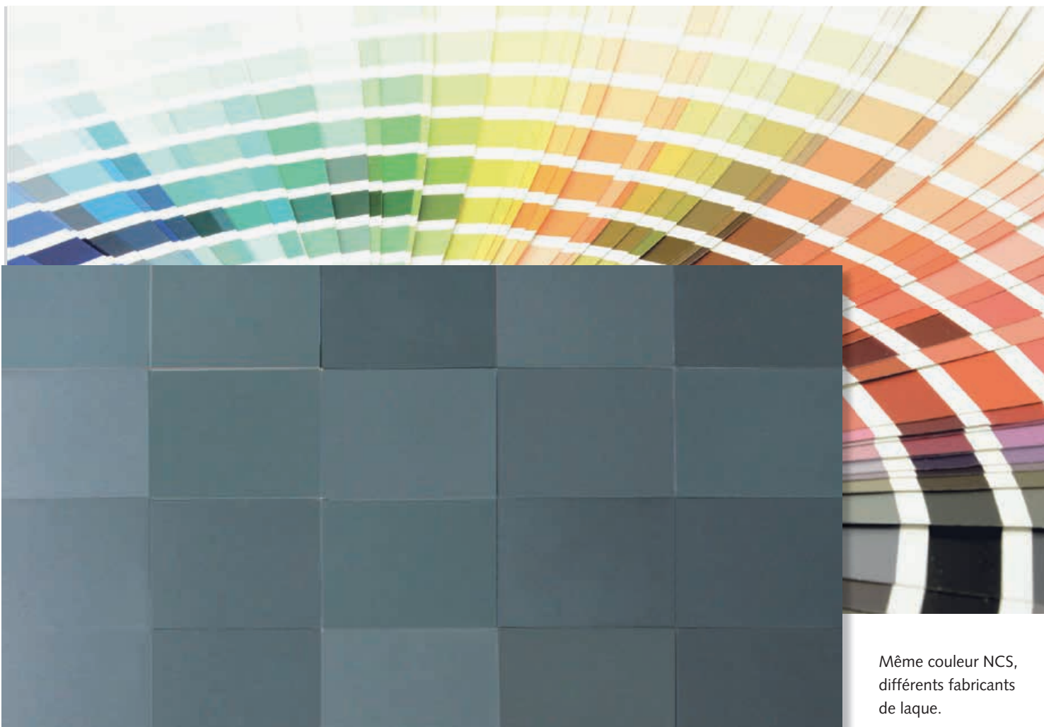
Même couleur NCS, différents fabricants de laque.

De nombreux objets et composants dans et sur nos maisons sont livrés dans des couleurs qui correspondent à des collections définies. Les radiateurs et les portes des pièces ont été construits dans la couleur RAL 9010 et la porte de jardin en vert mousse RAL 6005. La couleur de la façade a peut être été choisie à l'aide d'un nuancier NCS et l'architecte d'intérieur a sélectionné la couleur des murs dans une des nombreuses collections proposées par les différents fabricants de peintures.