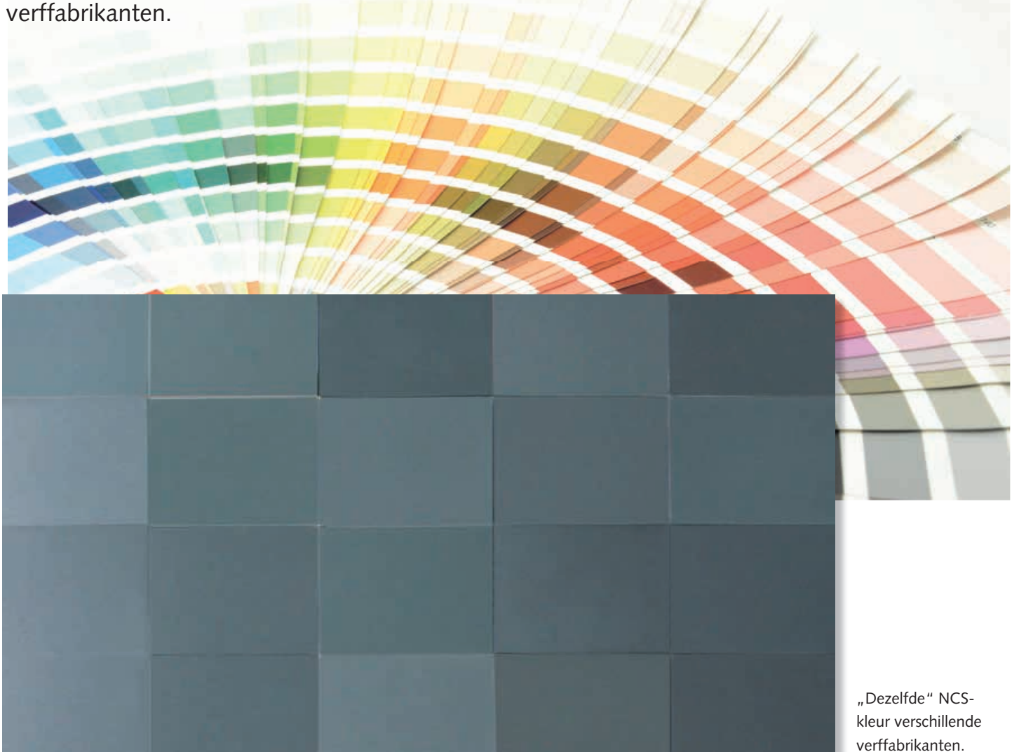
„Dezelfde“ NCS-kleur verschillende verffabrikanten.

Veel voorwerpen en bouwelementen in en aan onze huizen worden geleverd in kleuren die overeenkomen met bepaalde kleurcollecties. De verwarmingselementen en de kamerdeuren worden in de kleur RAL 9010 ingebouwd, het tuinhek is mosgroen RAL 6005. De kleur van de gevel is wellicht met behulp van een NCS-waaier uitgezocht en de binnenhuisarchitect heeft de wandkleuren geselecteerd uit een van de ontelbare kleurcollecties van verschillende verffabrikanten.